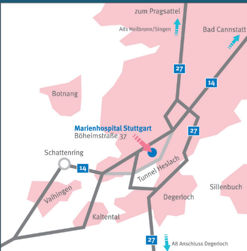
Anfahrt mit dem Auto