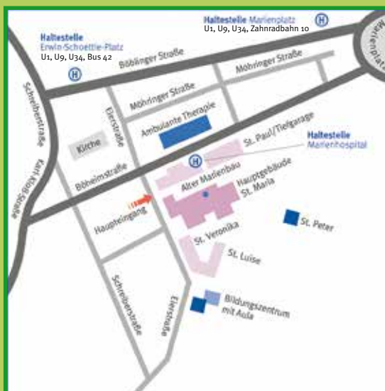
Anfahrt mit Bus und Bahn