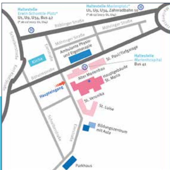
Anfahrt mit Bus und Bahn