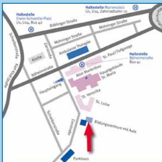
ANFAHRT MIT BUS UND BAHN