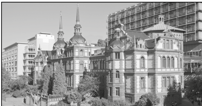
Das Marienhospital liegt an der Ecke Böheimstraße/Eierstraße.