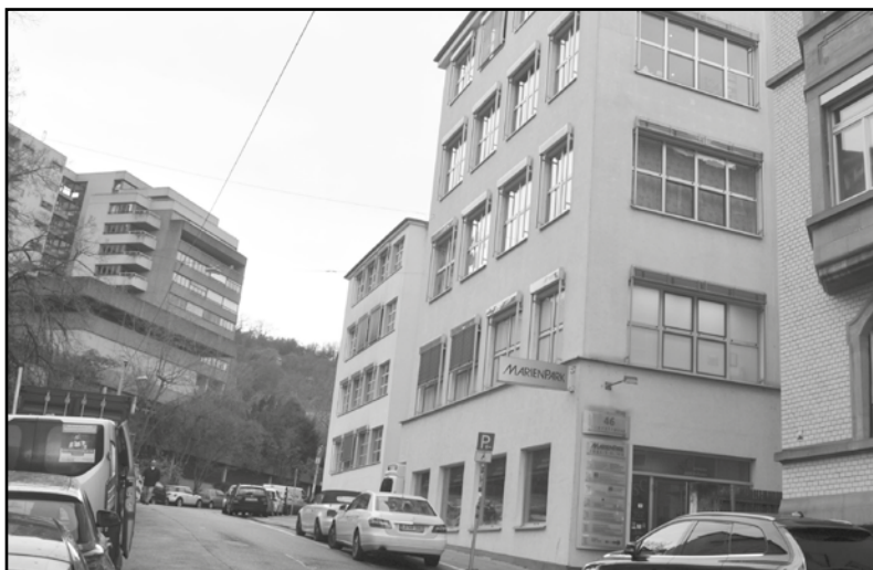
Das Arbeitsmedizinische Institut finden Sie im 5. Stock im Marienpark, Eierstr. 46.