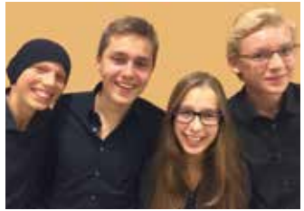
links: Sprecherensemble der Akademie für gesprochenes Wort rechts: Musiker der Musikschule Stuttgart

W ir möchten Sie, Ihre Familie, Freunde und Bekannte herzlich zur Adventsmatinee 2015 des Palliativvereins einladen und heißen Sie in der Aula des Bildungszentrums im Marienhospital willkommen.