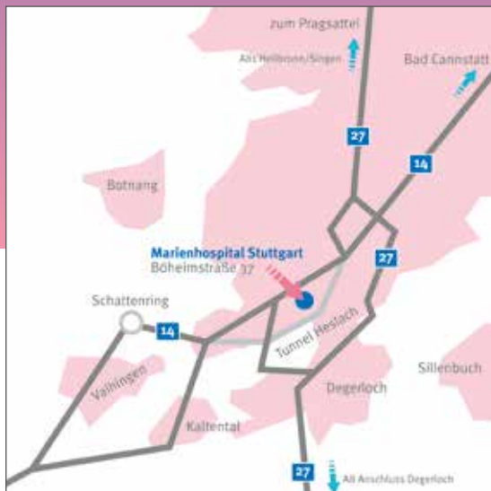
Anfahrt mit dem Auto