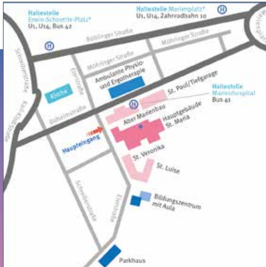
Anfahrt mit Bus und Bahn