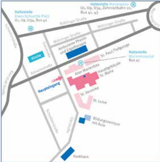
Anfahrt mit Bus und Bahn