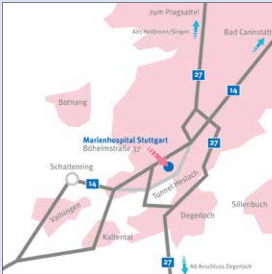
Anfahrt mit dem Auto