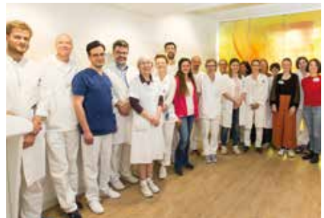
Als Schwerkranker rundum kompetent versorgt: vom Expertenteam der beiden Palliativstationen

Zusätzlich finden jedes Jahr Informationstage und Fortbildungsveranstaltungen für Patienten statt. Ziel ist, Sie und Ihre Angehörigen in die Behandlung der Erkrankung miteinzubinden.